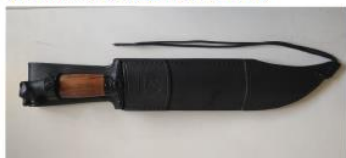
Modelo Onça Negra

c) Link de compra: http://htfacas.com.br