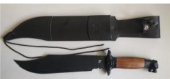
Modelo Onça Negra

d. enviar para o CIGS o comprovante de pagamento por intermédio do e-mail: facocigs@gmail.com ;